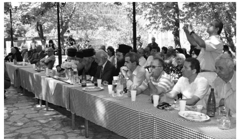
Άποψη από τους επισήμους και το κοινό που παρακολουθεί τις εργασίες του Συνεδρίου στα Βραγγιανά.

στο Γένος μας. Ο Ευγένιος Γιαννούλης ο Αιτωλός, ο Αναστάσιος Γόρδιος , ο Θεοφάνης ο εκ Φουρνά , ο Δημήτριος Χατζηπολυζώης είναι μερικές σημαντικές μορφές από τον χώρο των γραμμάτων, που αναδείχθηκαν μέσα από την ακάματη γραφίδα του Πάνου Βασιλείου.