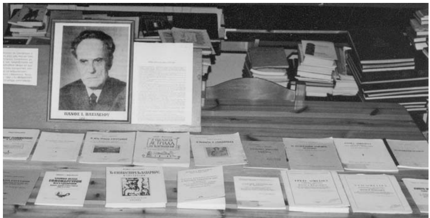
Από την έκθεση βιβλίων του Πάνου Βασιλείου