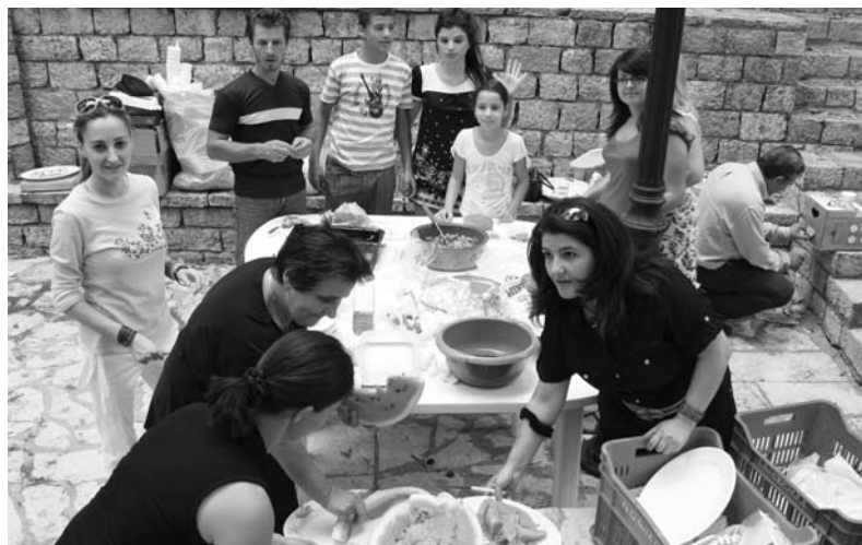
Η ομάδα παρασκευής και εξυπηρέτησης του γεύματος στα Βραγγιανά