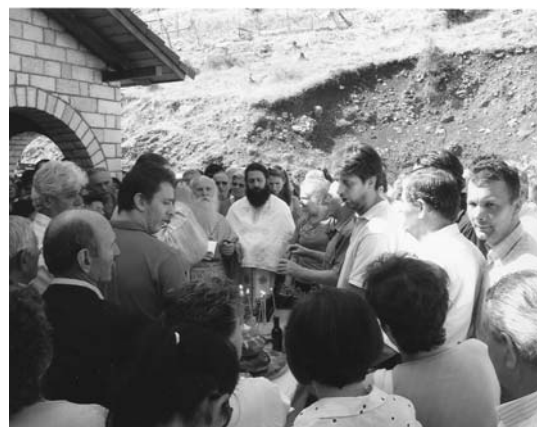
Αρτοκλασία στον Αγ. Κοσμά τον Αιτωλό στον Έλατο Βραγγιανών

Στην όλη λαμπρή εκδήλωση παραβρέθηκαν και