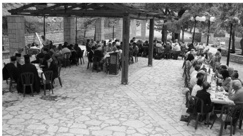
Το νηστήσιμο γεύμα στα Βραγγιανά