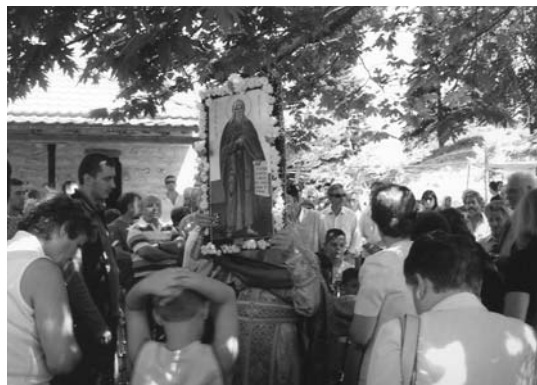
Από την ύψωση της εικόνας του Προφήτη Ηλία στο Τριδένδρο Αγράφων

Βιώσαμε και χαρήκαμε την πλούσια γνώση των εκλεκτών εισηγητών και βυθιστήκαμε στο αμετάβλητο βασίλειο του πνεύματος της ιστορίας των Γραμμένων Αγράφων με τους Θεοφιλείς και Εθνωφελείς μεγάλους δασκάλους και ευεργέτες του Έθνους μας, Όσιο Ευγένιο τον Αιτωλό, Αναστάσιο Γόρδιο το Βραγγιανίτη, τον εκ Φουρνά Θε-