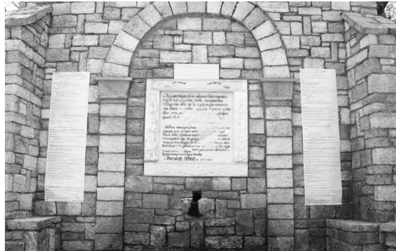
Η πηγή «Φοντάνα» με το πρόγραμμα του Συνεδρίου

σιος Γόρδιος" , αναρτήθηκε το πρόγραμμα των 3 ημερών του συνεδρίου. Προηγήθηκε κατασκευαστική αρχιτεκτονική Θεία Λειτουργία στον Ι.Ν. της Αγίας Παρασκευής, ιερουργούντων