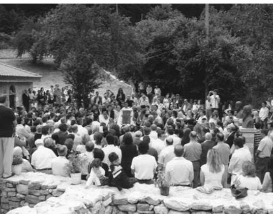
Ύψωση της εικόνας της Αγ. Παρασκευής

«Απόψε αισθάνομαι ιδιαίτερη χαρά και συγκίνηση, γιατί εδώ σε αυτή τη μεγάλη σύναξη, δημοτική βραδιά, συμμετέχει ολόψυχα όλο το χωριό (Καρυά, Έλατος, Κουστέσσα, Δένδρος, Βαλάρι, Καλυβάκια, Ζερβομαχαλάς, Στανάδες, Παρθενείκα, Απάνω Μαχαλάς). Τούτο σημαίνει πως είμαστε όλοι Βραγγιανίτες, ένας λαός και πρέπει να συμπεριφερόμαστε ως σύνολο, γιατί το πλήθος, το οποίο δεν καταλήγει στην ένωση, αποτελεί σύγχυση, μπερδεμα, ανακάτωμα.