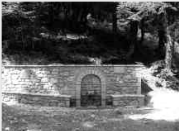
Στη μαγευτική θέση Άγιος Αθανάσιος Βραγγιανών η πέτρινη βρύση, έργο του Συλλόγου Αϊ-Γιάννης ο Θεολόγος

Τους ευχαριστούμε θερμά όλους και τους συγχαίρουμε για τα καλά τους έργα. Η σύνταξη