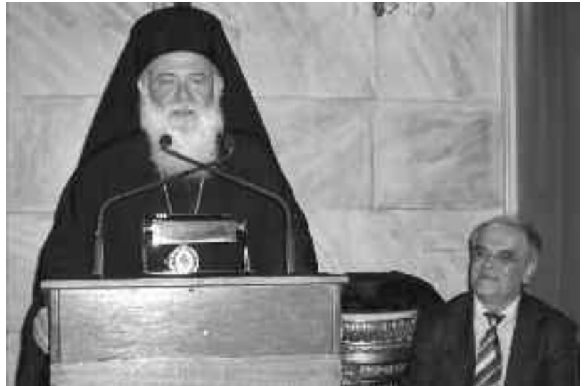
΄Ο Μακαριώτατος Αρχιεπίσκοπος Αθηνών και πάσης Ελλάδος κ. Ιερώνυμος στο βήμα τής Παλαιάς Βουλής, μέ τούς εισηγητές τής εκδήλωσης.

Στή συνέχεια, ό συντονιστής τής παρουσίασης τών Πρακτικών, όμότιμος